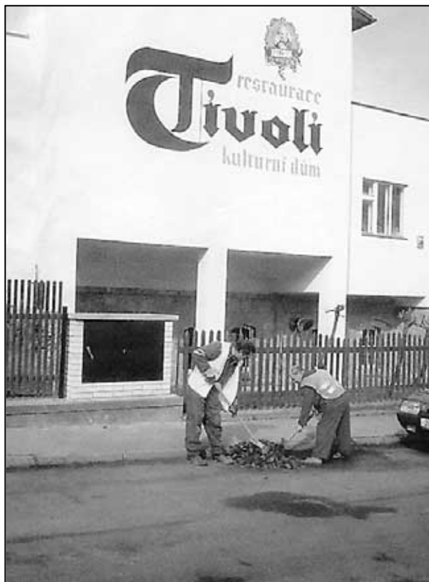
Jarní úklid před restaurací Tivoli.