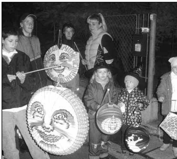
Zahájení lampionového průvodu před školou