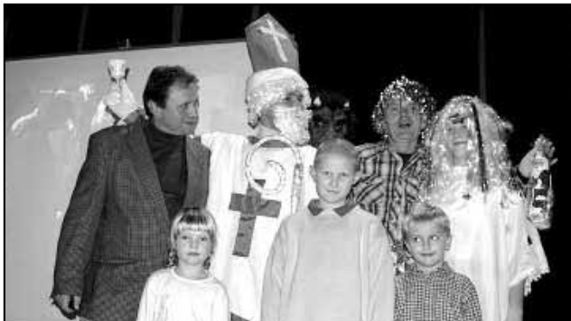
Loučení s Mikulášem