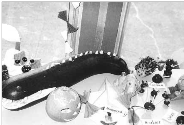
Práce rodičů a dětí.