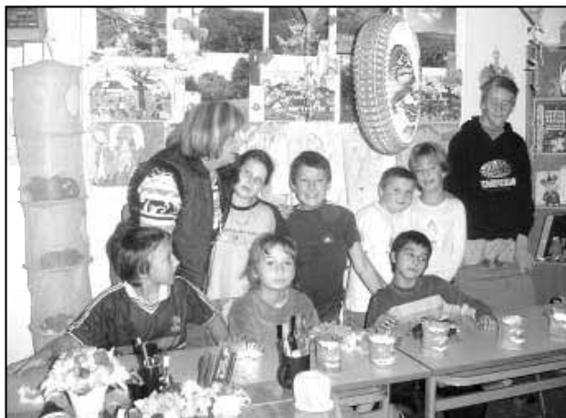
Žáci I.třídy vyrábějí dekorace k svátku Halloween

Koncem října jsme uspořádali 1.ročník lampionového průvodu, kterého se zúčastnila většina žáků školy, včetně ně-