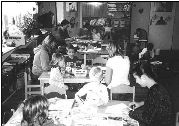
Tvořivé odpoledne s rodiči.

Samy děti se také pochlubily svojí dovedností. Šatnu si ozdoby otisky listů a bramboráčky, které si zhotovily z došených brambor, z nasbíraných šípků, kaštanových skořápek, slunečnicových semínek aj. přírodnin. Děti pracovaly s velkou chutí a během chvílky se brambory měnily v lesní strašidla, ježky, čerta a kachničku. Také děti z výtvarného kroužku přispěly svými výtvarnými hračkami inspirovanými podzimem k výzdobě interiéru školky. V celé školce zavládl podzim.