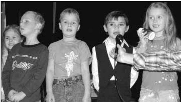
Vystoupení Mateřské školky