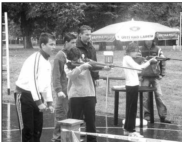
Střelba ze vzduchovky při branném závodě