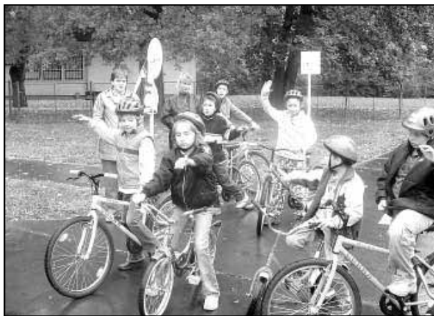
Výuka žáků I.třídy na dopravním hřišti