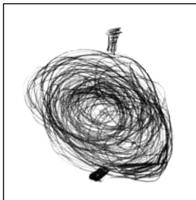
Eliška Pláteníková - 5 let

Od září rodiče přispívají měsíčně na provoz mateřské školy, tzv. „školné“, částku 100 Kč na dítě. Tento příspěvek je použitý na krytí nákladů na vytápění, dodávku vody, elektrické energie, na nákup, nebo opravu vybavení zařízení.