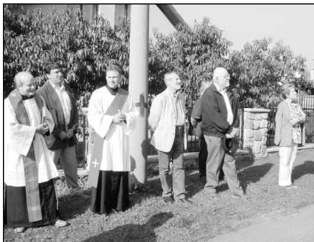
Tito jmenovaní se na obnově kříže podíleli.