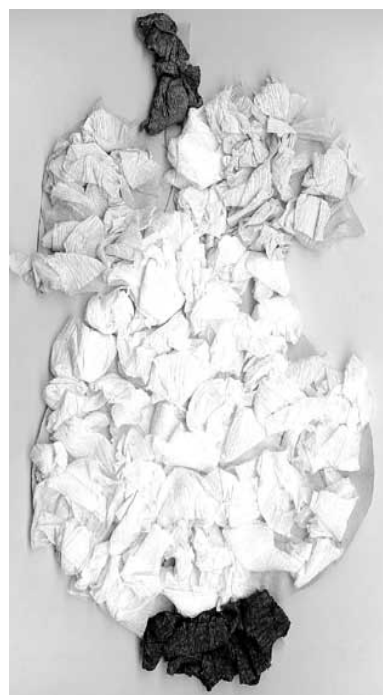
Ivanka Fischerová, 4. roky